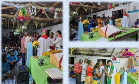
Penerimaan Sakramen Krisma di Aniadai, Paroki Bamu 21 Januari 2024