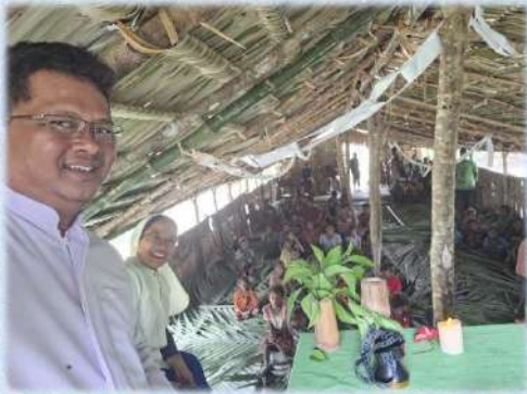
Persiapan Misa dan Penerimaan Krisma di Stasi St. Philip Gumai, Paroki Bamu 23 Januari 2024