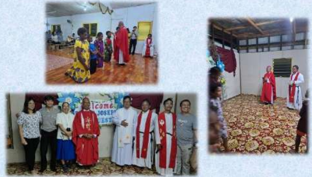
Penerimaan Sakramen Krisma dan Pemberkatan Gedung Pastoral di Kamusie 20 Januari 2024