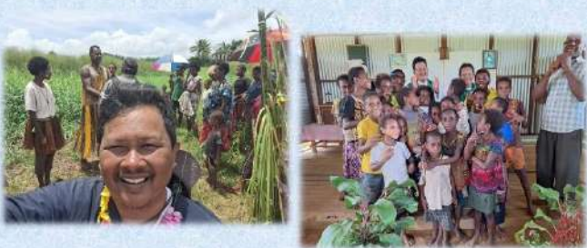
Sambutan Umat Stasi Aketa, Paroki Balimo 4 Februari 2024