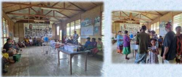
Ucapan Syukur atas Pembaharuan Janji Perkawinan Pasutri Paroki Matkomnai 31 Desember 2023