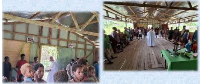
Pemberkatan Gereja dan Penerimaan Sakramen Perkawinan di Stasi St. James Maisawe, Paroki Bamu 23 Januari 2024