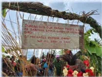
Sambutan Umat Stasi St. Gabriel Bimaramio, Paroki Bamu atas kedatangan Bapak Uskup dan rombongan 21 Januari 2024