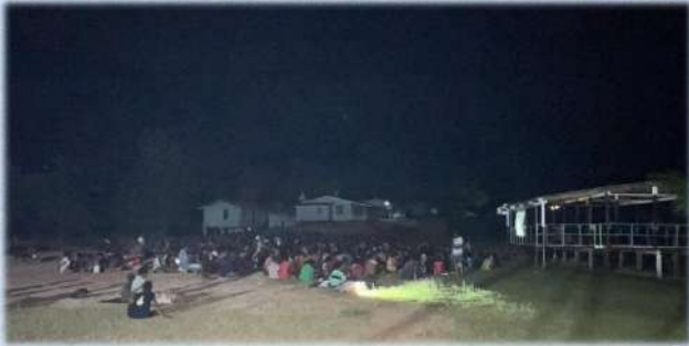
Nonton Bareng dalam rangka Malam Pergantian Tahun di Halaman Gereja Bosset, 31 Desember 2023