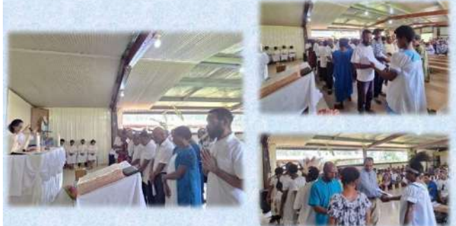
Pembaharuan Janji Perkawinan dan Penerimaan Sakramen Perkawinan di Paroki Matkomnai 31 Desember 2023