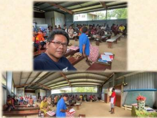
Pertemuan Orang Tua Murid TK Ningerum 20 Februari 2024