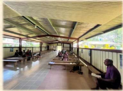
Pembinaan Lektor Paroki Matkomnai 24 Februari 2024