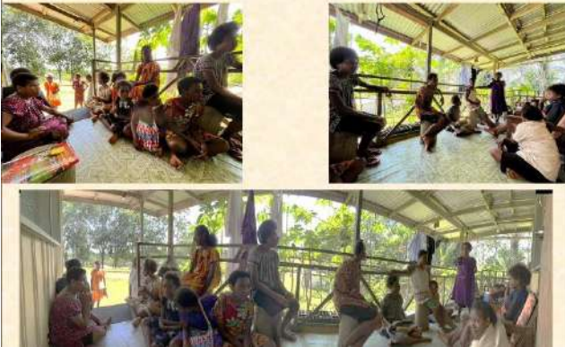
Pertemuan Petugas Liturgi Paroki Matkomnai 25 Februari 2024