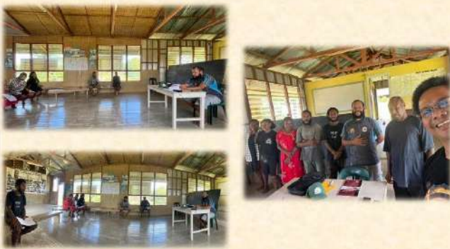
Pertemuan Komisi Kepemudaan Keuskupan di Paroki Matkomnai 28 Februari 2024