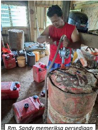
Rm. Sandy memeriksa persediaan bahan bakar minyak untuk patrol

membuat salib besar untuk dipanggul bersama atau bergantian. Hal lain adalah pelaksanaan upacara Cahaya dalam Vigili Paskah, baik di Paroki Matkomnai, Paroki Kungim, dan Paroki Balimo, memulai upacara cahaya dari halaman Gereja dengan membuat api unggun yang diikuti oleh seluruh umat yang hadir, baru kemudian berarak bersama memasuki Gereja.