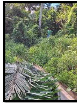
Exultate Yang Pertama Sabtu, 30 Maret 2024