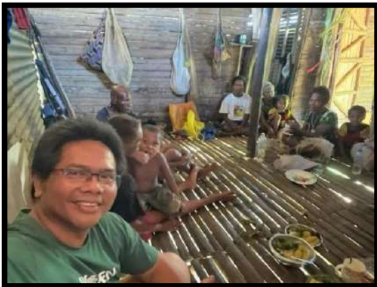
Perjalanan Ziarah ke Nongire dan Waiginai Rabu, 3 April 2024

Pukul 11.00 pm aku nguantuk dan pamit tidur..... Thank You Lord.