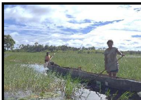
Kano: moda transportasi penduduk di Balimo

Oleh karena itu, penjadwalan misa harus dikomunikasikan dengan para pemimpin umat. Untuk di pusat paroki dapat disepakati bersama melalui pertemuan antara romo dengan pemimpin umat. Sedangkan untuk jadwal di stasi, dapat menggunakan komunikasi melalui telepon. Namun hal ini tidak