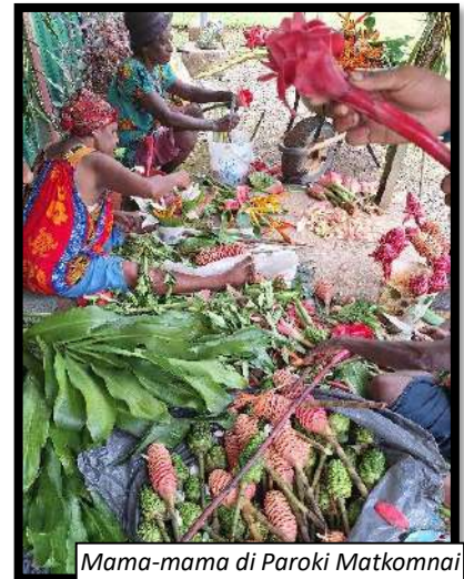
Mama-mama di Paroki Matkomnai sedang merangkai bunga

Dekorasi Gereja dan altar, juga tidak luput dari perhatian umat. Mereka akan mempersiapkan aneka bunga dan tanaman, mulai dari yang ada di sekitar mereka hingga mencari ke hutan. Selain itu, lingkungan sekitar Gereja juga perlu dibersihkan, ditata dan diperindah dengan memotong rumput di kompleks Gereja. Konsep peribadatan juga direncanakan dengan seksama. Untuk Jalan Salib Pekan Suci, pelaksanaannya tidak hanya di dalam Gereja, tetapi mengelilingi kampung, sebagaimana yang terjadi di Paroki Kungim dan Paroki Matkomnai atau dimulai dari water front sampai ke Gereja, seperti yang terjadi di Paroki Balimo. Umat akan mempersiapkan sarana dan prasarana, mulai membuat rute Jalan Salib, membuat penanda pemberhentian Jalan Salib, dan