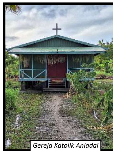
Gereja Katolik Aniadai