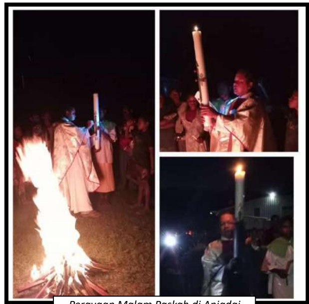
Perayaan Malam Paskah di Aniadai