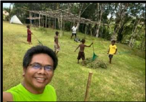
Rm. Paryanto dan umat Paroki Matkomnai membersihkan halaman gereja untuk persiapan Pekan Suci

dapat dilakukan untuk semua stasi, karena ada beberapa stasi yang tidak terjangkau sinyal telepon. Ada kalanya, kami mengutus orang untuk menyampaikan kabar mengenai kunjungan romo kepada umat di stasi, seperti yang terjadi di Paroki Matkomnai dan Paroki Bamu. Untuk Paroki Bamu, juga ada hal khusus yang perlu diperhatikan, agar jadwal kunjungan romo dapat berjalan lancar, yaitu jadwal menangkap ikan di laut. Sebagian besar umat Paroki Bamu adalah nelayan, yang mana mereka mempunyai perhitungan khusus berdasarkan alam mengenai kondisi dan jumlah ikan di laut. Jika jadwal melaut tiba, maka umat yang berprofesi sebagai nelayan akan meninggalkan kampung mereka selama beberapa hari untuk melaut dan menangkap ikan.