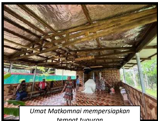
Umat Matkomnai mempersiapkan tempat tuguran