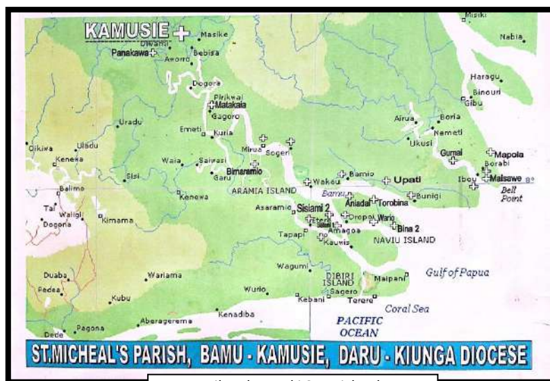
Peta Wilayah Paroki St. Michael Bamu