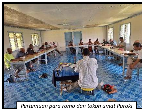
Pertemuan para romo dan tokoh umat Paroki Balimo membahas Persiapan Pekan Suci

Untuk itu dalam merayakan Pekan Suci tahun 2024 ini, kami perlu dan harus mempersiapkan diri dengan baik dan melibatkan umat untuk bersama-sama mempersiapkan dan merayakannya. Pertama-tama, kami mendengarkan berbagai informasi, cerita, komentar, dan masukan dari tokoh umat berkenaan dengan perayaan Pekan Suci Paskah yang telah terjadi pada tahun-tahun sebelumnya. Pada umumnya, setiap paroki akan mengadakan pertemuan dengan para tokoh umat untuk membahas hal ini. Aneka informasi ini penting bagi kami, agar kami dapat memiliki gambaran mengenai situasi dan kondisi umat serta aneka persiapan yang harus kami lakukan, sehingga perayaan Pekan Suci Paskah tahun ini dapat direncanakan, dilaksanakan dan dirayakan dengan baik.