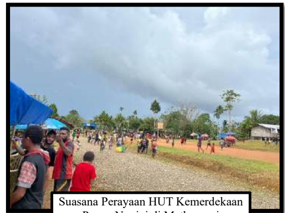
Suasana Perayaan HUT Kemerdekaan Papua Nugini di Matkomnai

Kedua , pada tanggal 16 September 2024 ini, Papua Nugini merayakan kemerdekaannya yang ke-49. Meskipun, kami, para romo CM, yang berkarya di Keuskupan Daru-Kiunga ini bukan warga negara Papua Nugini, namun kami juga merasakan sukacita dan kegembiraan dalam merayakan hari kemerdekaan tersebut dengan berbau bersama umat dan masyarakat dalam perayaan Ekaristi, upacara bendera, perayaan ekaristi, pertandingan olah raga, pentas seni, dan pesta rakyat. Dalam Surat Gembala dalam memperingati Hari Kemerdekaan Papua Nugini ke-49, Bapa Uskup Daru-Kiunga, Mgr. Joseph Durero, SVD mengajak umat beriman untuk merefleksikan perjalanan negara Papua Nugini sejak memperoleh kemerdekaan