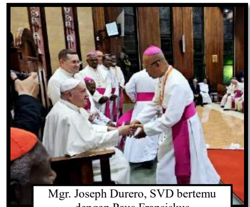
Mgr. Joseph Durero, SVD bertemu dengan Paus Fransiskus

dan para misionaris, yaitu keberanian, keindahan, dan harapan. Bapa Suci menekankan akan pentingnya keberanian dalam memulai inisiatif-inisiatif misionaris dengan mengambil inspirasi dari para misionaris awali yang menghadapi banyak tantangan, namun tetap terjaga iman mereka. Bapa Suci juga menggarisbawahi akan keindahan kehadiran dalam hidup bersama, melayani sebagai rumah yang ramah dan berbagi sukacita mengikuti Yesus bersama-sama. Kemudian, Bapa Suci menekankan juga harapan akan