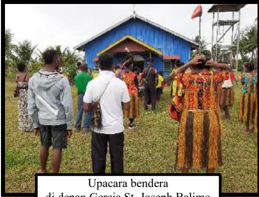
Upacara bendera di depan Gereja St. Joseph Balimo

pertumbuhan, yaitu keberanian kaum beriman untuk melanjutkan menebarkan benih-benih Injil dengan percaya kepada rahmat Tuhan. Lebih lanjut, Bapa Suci menyebut bahwa kaum beriman dipanggil untuk menjadi sarana cinta Tuhan, untuk memfokuskan pada mereka yang terpinggirkan, dan untuk menumbuhkembangkan budaya kedekatan, belarasa, dan kelembutan dalam berelasi satu sama lain.