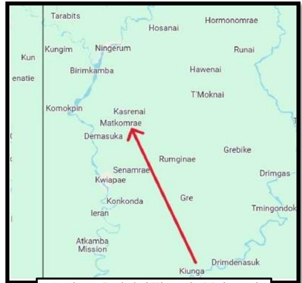
Gambaran Jarak dari Kiunga ke Matkomnai

Oleh karena itu, pada hari Sabtu-Minggu, 15-16 Februari 2025 ini, para romo CM mengadakan kegiatan di Pastoran Paroki St. John Matkomnai. Mengapa di Matkomnai? Hal ini disebabkan Paroki St. John Matkomnai adalah domus /rumah bagi para romo CM yang berkarya di Keuskupan Daru-Kiunga. Adapun jarak Matkomnai dari Kiunga sekitar 50 km, yang dapat ditempuh dengan mobil melalui satu-satunya jalan utama yang cukup baik, karena selalu dilakukan pemeliharaan.