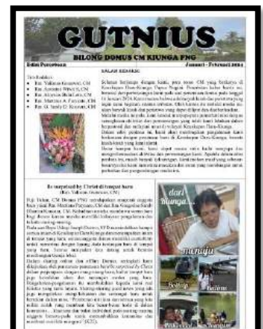
Gutnius Edisi Perdana (Februari 2024)

Dalam perjalanan 1 tahun buletin ini, ada banyak hal yang kami alami dan itu merupakan sebuah proses yang memberikan banyak pembelajaran dan pengalaman bagi kami dengan segala jatuh-bangunnya. Hal pertama yang kami alami adalah cara mengeksekusi buletin ini. Dalam hal ini media, aplikasi, dan software apa yang akan kami gunakan untuk menuangkan kisah-kisah kami. Hal ini disebabkan, kami, para romo, yang berkarya di Papua Nugini ini, belum pernah terlibat langsung dalam kegiatan produksi buletin.