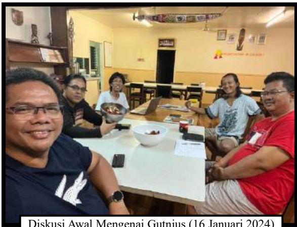
Diskusi Awal Mengenai Gutnius (16 Januari 2024)