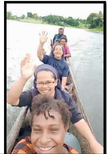
Para Suster KYM melakukan turne di wilayah Paroki Bosset

Setelah beberapa hari agak "terganggu" dengan cerita sedih mereka, saya menelepon bapak ketua stasi dan mereka yang pernah saya temui di pasar dan di toko. Lewat telpon itu, saya bertanya kepada mereka "Apa yang bisa saya lakukan untuk membantu kalian?" Tolong bantu kami dengan kalender liturgi