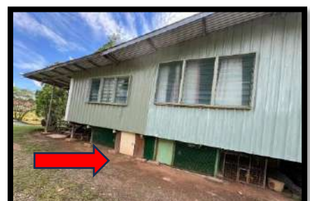
Kandang ayam di bawah Pastoran Matkomnai