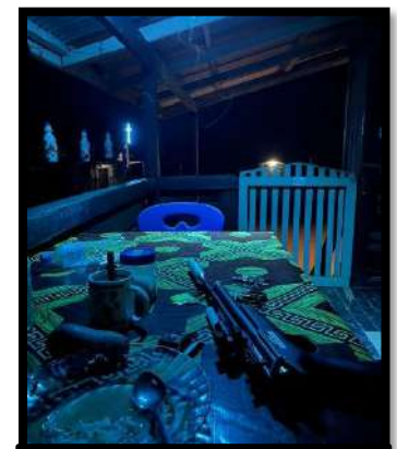
Rm. Wiwit Persiapan Menembak

Berbeda dengan Rm. Wiwit di Kungim. Rm. Wiwit memelihara ayam-ayamnya dengan dibiarkan bebas berkeliaran di sekitar kompleks gereja pada pagi sampai sore hari. Hanya menjelang malam, ayam-ayam itu pulang ke kandang. Namun ternyata tidak mudah memelihara ayam-ayam yang dibiarkan bebas, ada yang mengancam nyawa ayam-ayam tersebut, yaitu anjing. Tidak jarang, ayam-ayam itu diburu anjing