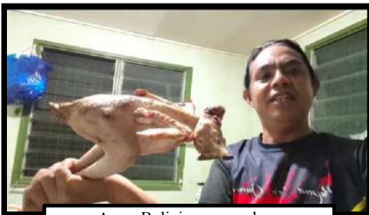
Ayam Bolivip yang malang

Berbeda dengan Rm. Wiwit di Kungim. Rm. Wiwit memelihara ayam-ayamnya dengan dibiarkan bebas berkeliaran di sekitar kompleks gereja pada pagi sampai sore hari. Hanya menjelang malam, ayam-ayam itu pulang ke kandang. Namun ternyata tidak mudah memelihara ayam-ayam yang dibiarkan bebas, ada yang mengancam nyawa ayam-ayam tersebut, yaitu anjing. Tidak jarang, ayam-ayam itu diburu anjing