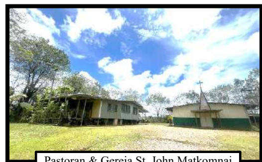
Pastoran & Gereja St. John Matkomnai