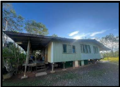
Pastoran Matkomnai sebagai Domus CM Papua Nugini