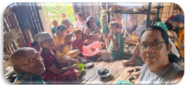
Pertemuan untuk Kegiatan HUT Kemerdekaan Papua Nugini