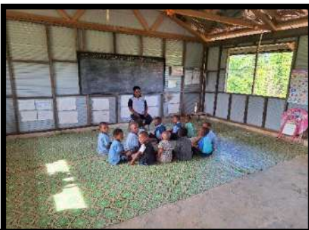
Suasana di TK Yenkenai

CM lainnya mulai digagas dan direncanakan untuk mendirikan Taman Kanak-Kanak bagi anak-anak usia dini di Pusat Paroki Matkomnai, Stasi Yenkenai, dan Stasi Dande. Para romo bekerja sama dengan kepala kampung, pemangku tanah adat, dan para ketua lingkungan, akhirnya dapat mewujudkan terbentuknya Taman Kanak-Kanak tersebut. Saat ini, sekolah-sekolah ini sudah berkembang, baik dari jumlah siswa dan jumlah sekolah. Untuk di wilayah Paroki Matkomnai, ada 5 sekolah TK yang