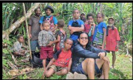
Anak-anak menemani Rm. Aloy turne