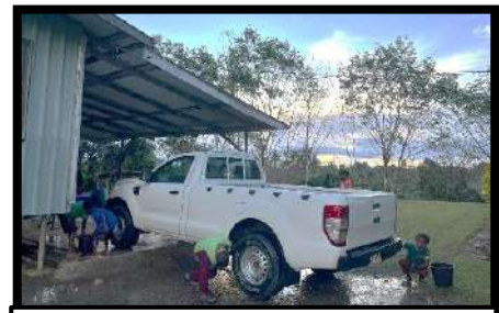
Anak-anak mencuci mobil di Pastoran Matkomnai

Di dalam hidup menggereja, anak-anak termasuk umat yang rajin dalam mengikuti Perayaan Ekaristi, sehingga komuni “bathuk” (berkat untuk anak) seringkali menjadi lebih banyak dibanding komuni Tubuh Kristus. Dalam hal liturgi, anak-anak dilibatkan dalam koor dan tarian perarakan. Bahkan dalam perayaan Kamis Putih 2024 di Paroki Our Lady of Papua Kungim, anak-anak berperan sebagai rasul yang dibasuh kakinya. Sedangkan kegiatan rohani lainnya untuk anak-anak adalah sekolah minggu, misdinar, dan devosi Kerahiman Ilahi. Tidak jarang, anak-anak juga diajak untuk turne ke stasi-stasi terdekat untuk menemani romonya. Sesekali para romo mengapresiasi kehadiran anak-anak dalam mengikuti perayaan Ekaristi ini dengan memberi mereka wafer atau permen setelah misa, agar anak-anak semakin rajin dan bersemangat.