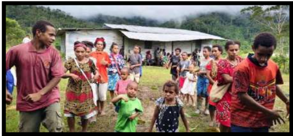
Patrol di Stasi Simentimbip

kegembiraan bersama. Semoga perayaan ini membawa sesuatu yang baru dalam diri umat dan juga pastor parokinya untuk terus melanjutkan semangat dari Beato Peter To Rot.