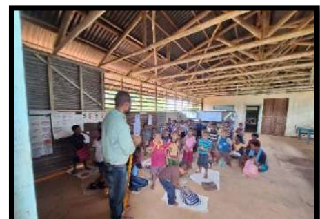
Suasana di TK Kungim