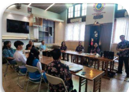
Kunjungan di SMAK St. Louis 1 Surabaya