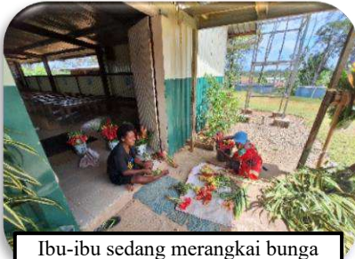
Ibu-ibu sedang merangkai bunga di Gereja Matkomnai

patrol stasi ke 2 stasi lainnya yang lokasinya jauh dari pusat paroki, yaitu Stasi Sapphire dan Stasi Mahomnai, 4 hari setelah Hari Raya Natal.