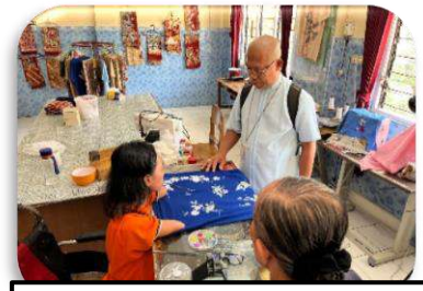
Kunjungan di Bhakti Luhur Malang