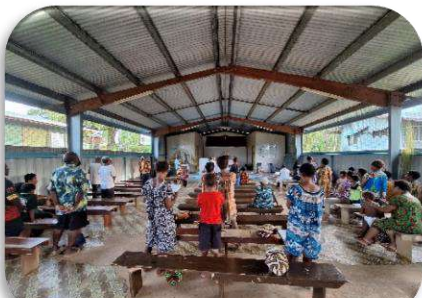
Misa Hari Raya Natal Di Stasi Ningerum