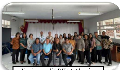
Kunjungan di SDK St. Aloysius Surabaya