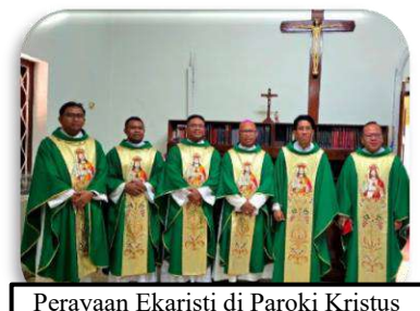
Perayaan Ekaristi di Paroki Kristus Raja, Surabaya