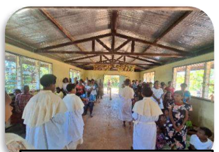
Misa Natal Di Stasi Grehosore