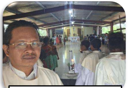
Misa Hari Raya Natal di Matkomnai