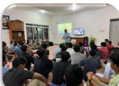
Kunjungan di Seminari Tinggi CM Malang