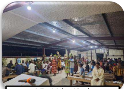
Misa Malam Natal di Matkomnai