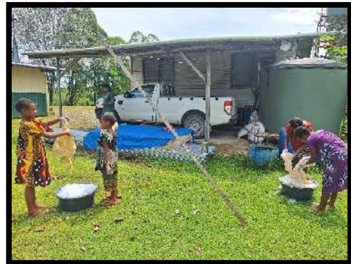
Rm. Paryanto Cuti

Setelah Perayaan Ekaristi pada hari Minggu, 4 Januari 2026, beberapa anggota misdinar melakukan cuci pakaian liturgi, yaitu pakaian misdinar, pakaian lektor, dan kasula. Semua pakaian liturgi ini telah digunakan selama perayaan Natal. Para misdinar ini mencuci pakaian liturgi di halaman belakang pastoran.