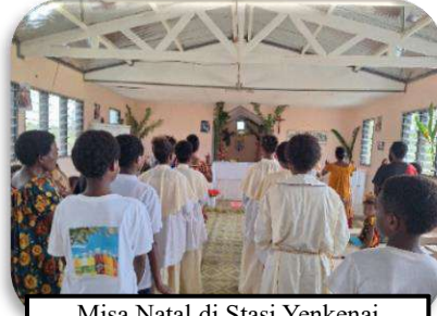
Misa Natal di Stasi Yenkenai