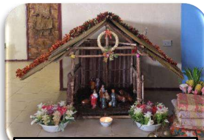
Kandang Natal di Paroki Matkomnai