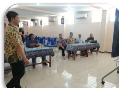
Kunjungan di SMAK St. Louis 2 Surabaya