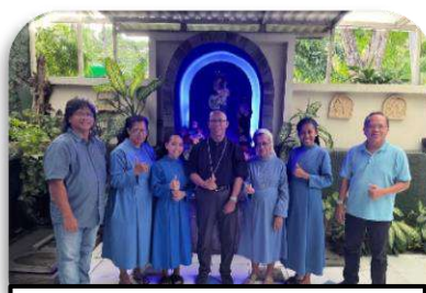
Kunjungan di Susteran PRR Surabaya