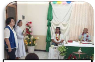
Kunjungan di Susteran KYM dan KKYM, Surabaya