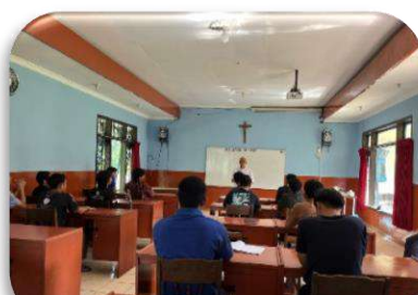
Kunjungan di Postulat Stela Maris Malang