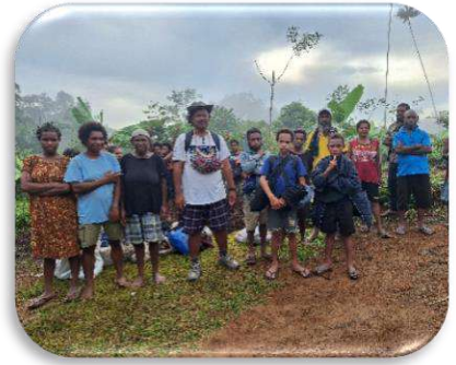
Misa Awal Tahun 2026