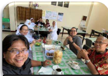
Kunjungan di Susteran Misericordia Malang