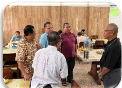
Kunjungan di Soverdi Surabaya