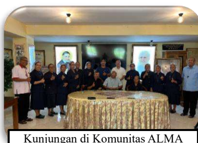
Kunjungan di Komunitas ALMA Malang