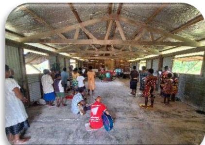
Misa Natal Di Stasi Tapko