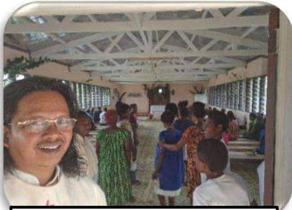
Misa Malam Natal di Stasi Yenkenai