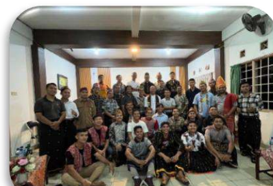
Kunjungan di Seminari Tinggi SMM Malang