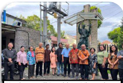
Kunjungan di Paroki St. Vincentius A Paulo, Malang