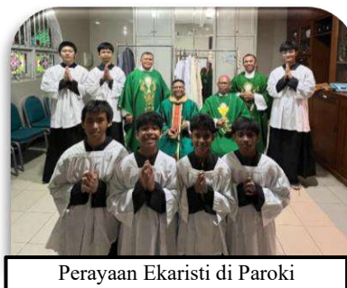
Perayaan Ekaristi di Paroki St. Kelahiran St. Perawan Maria, Surabaya