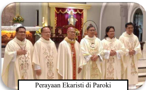
Perayaan Ekaristi di Paroki St. Vincentius A Paulo, Surabaya