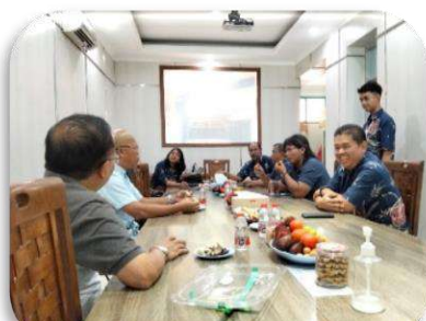
Kunjungan di SMK St. Louis Surabaya