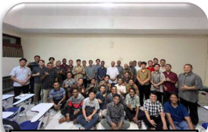
Kunjungan di Seminari Tinggi SVD Malang