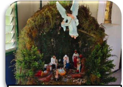
Kandang Natal di Paroki Bolivip