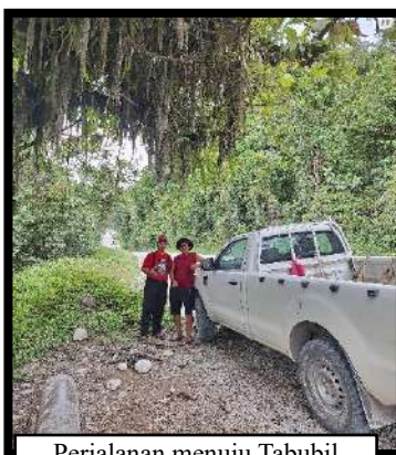
Perjalanan menuju Tabubil

Tabubil sendiri adalah kota pertambangan yang berada di dataran tinggi Pegunungan Bintang, yang dibangun oleh perusahaan pertambangan emas OK Tedi. Kota ini dibangun untuk mendukung pekerjaan tambang dan menjamin keamanan para pekerjanya. Oleh karena itu, di Tabubil terdapat berbagai infrastruktur yang bertaraf internasional, seperti bandara, pusat perbelanjaan, bank, penginapan, tempat olah raga, sekolah, rumah sakit, dan gereja. Selain itu, kota ini menerapkan High Security System , yang mana setiap orang yang keluar-masuk Tabubil harus mempunyai identitas yang jelas.