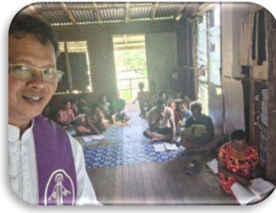
Misa di SCC Unity