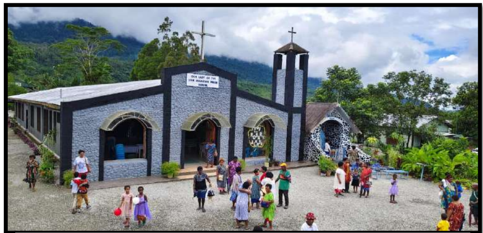
Suasana selesai Perayaan Ekaristi Minggu di Paroki Our Lady of Star Mountain, Tabubil

Dalam 2 bulan terakhir ini, kami para romo CM yang berkarya di Keuskupan Daru-Kiunga menjadi semakin akrab dengan kota Tabubil. Hal ini disebabkan sejak pertengahan bulan Februari 2026, bandara Kiunga sedang ditutup untuk perbaikan dan renovasi. Oleh karena itu, semua penerbangan dari dan menuju Kiunga, dialihkan ke Bandara Tabubil.