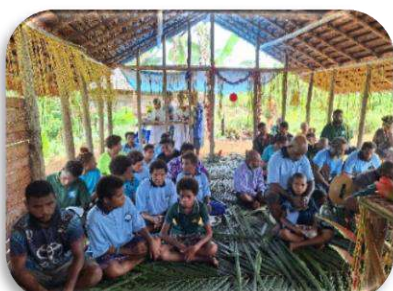
Kondisi Gereja Saepire saat Perayaan Natal 2025