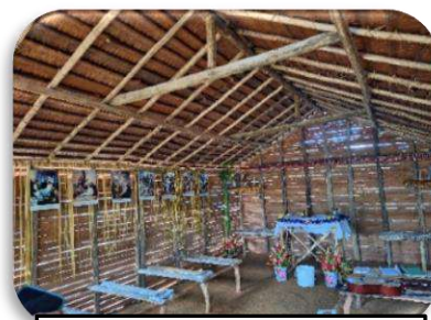
Kondisi Gereja Saepire saat Perayaan Paskah 2026

Untuk pertama kalinya, pada perayaan Paskah 2025, umat Saepire dapat merayakan Perayaan Ekaristi sendiri dengan membangun tenda darurat. Atas kunjungan perdana Rm. Paryanto ini, umat di Saepire semakin semangat untuk segera membangun gedung gereja semi permanen dari bahan-bahan yang ada di hutan, yaitu kayu dan batang palma hitam. Hasilnya, pada kunjungan kedua, yaitu Natal 2025, yang mana Rm. Sandy berkunjung ke Saepire, gedung gereja, sudah tampak bentuknya namun belum sempurna. Saat itu, umat Saepire berjanji bahwa mereka akan segera menyelesaikan bangunan gereja ini, sehingga pada Perayaan Paskah 2026, gedung gereja ini dapat diberkati dan digunakan sebagai pusat kegiatan rohani umat. Akhirnya, setelah melakukan koordinasi dengan Rm. Paryanto, diputuskan bahwa pada hari Minggu, 19 April 2026 akan dilaksanakan pembukaan Stasi baru dan pemberkatan gedung gereja baru di Saepire.