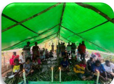
Kondisi Gereja Saepire saat Perayaan Paskah 2025

Saepire berada di tengah hutan yang hanya bisa dijangkau dengan berjalan kaki dengan menyusuri hutan berbukit-bukit dan menyeberangi 7 sungai. Bagi masyarakat setempat, jarak dari jalan raya menuju ke Saepire biasa ditempuh selama 3 jam berjalan kaki. Atas informasi ini, Rm. Paryanto meminta Ibu Anna untuk memastikan lagi dan menjanjikan akan mengunjungi umat di Saepire pada Paskah 2025. Dan selama Desember 2024 hingga menjelang Paskah 2025, Ibu Anna dan beberapa umat dari Stasi Nongire dan Stasi Waiginai rajin mengunjungi umat di Saepire untuk mengadakan ibadat Sabda bersama.