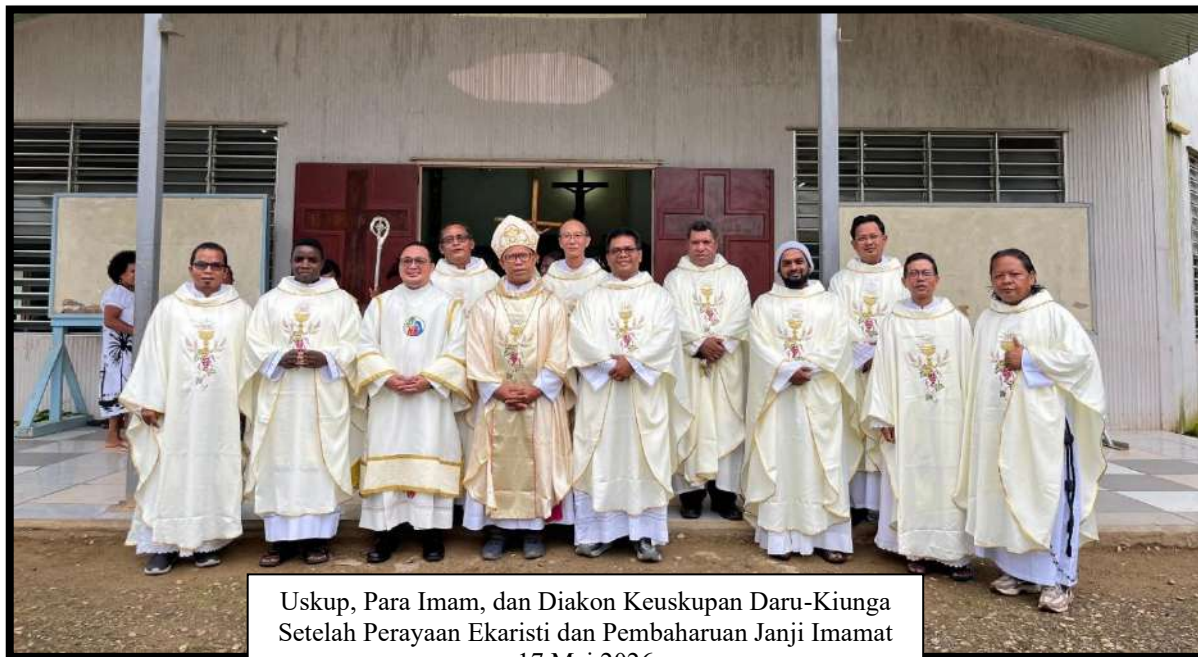
Uskup, Para Imam, dan Diakon Keuskupan Daru-Kiunga Setelah Perayaan Ekaristi dan Pembaharuan Janji Imamat 17 Mei 2026