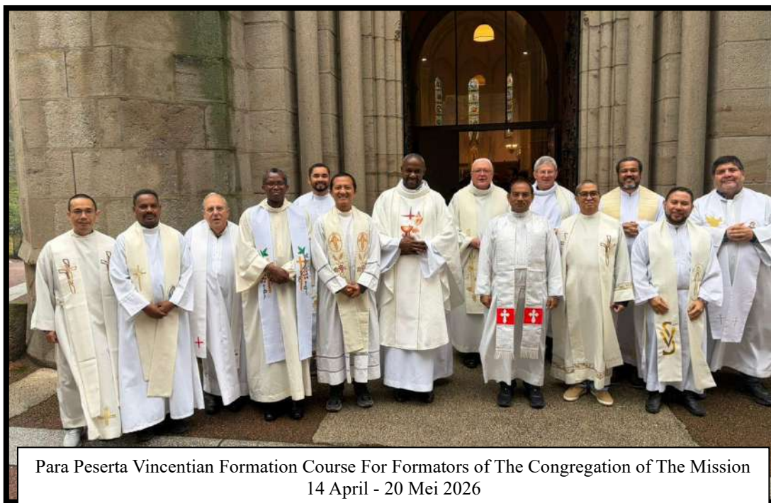
Para Peserta Vincentian Formation Course For Formators of The Congregation of The Mission 14 April - 20 Mei 2026